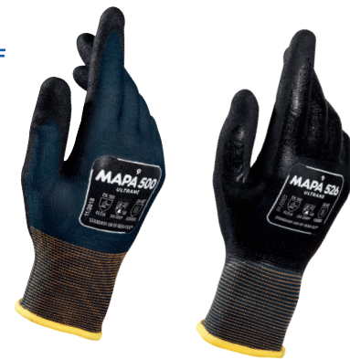
Handfläche und Finger beschichtet

Für allgemeine Wartungsbearbeiten in trockenen, öligen und fettigen Bereichen